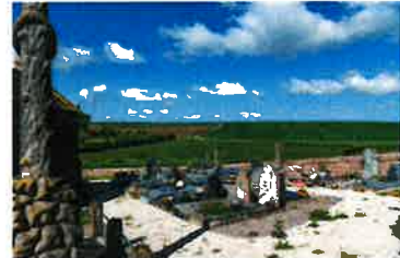
Vue générale depuis l'entrée nord du cimetière. IVR32_20236000606NUCA