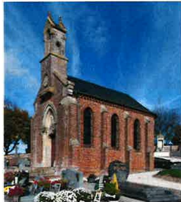
Vue générale de la chapelle Sainte-Reine depuis le sud-ouest.